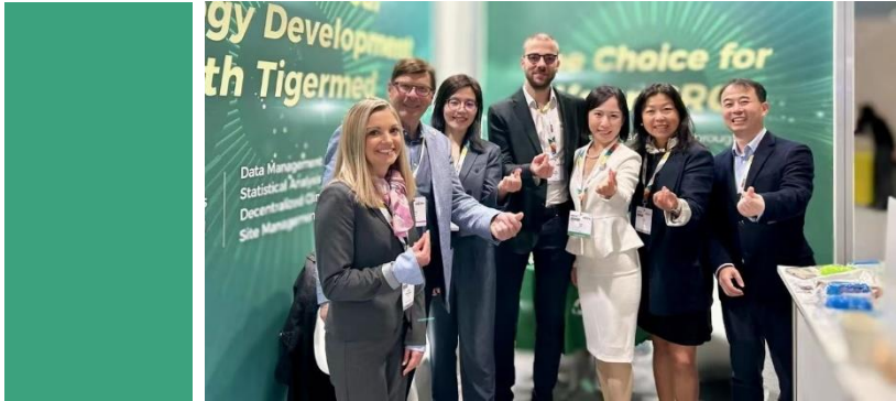
▲ 泰格医药团队参加2023ESMO大会 西班牙马德里