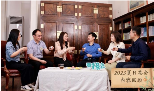
▲ 2023夏日茶会 中国北京